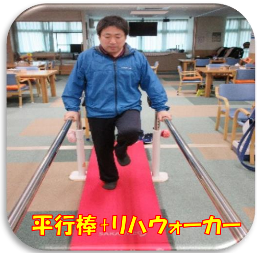
平行棒+リハウォーカー

各種リハビリ器具をご用意しております。また運動に関しても専属の職員が付き、個別指導を行いますので、安心してリハビリが行える環境を整えています。