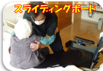
スライディングボード